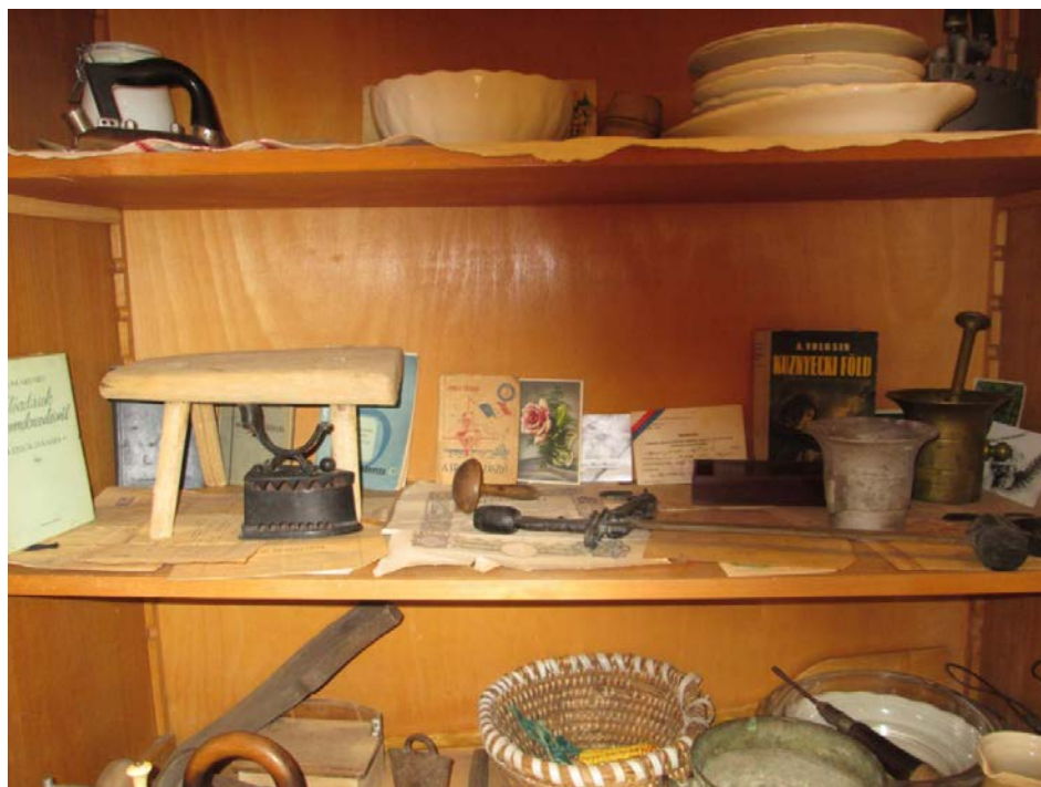
A helytörténeti szekrény kincsei