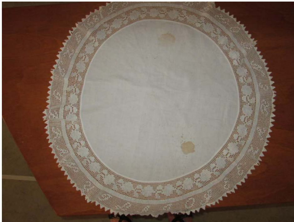
A 123 éves jegykendő