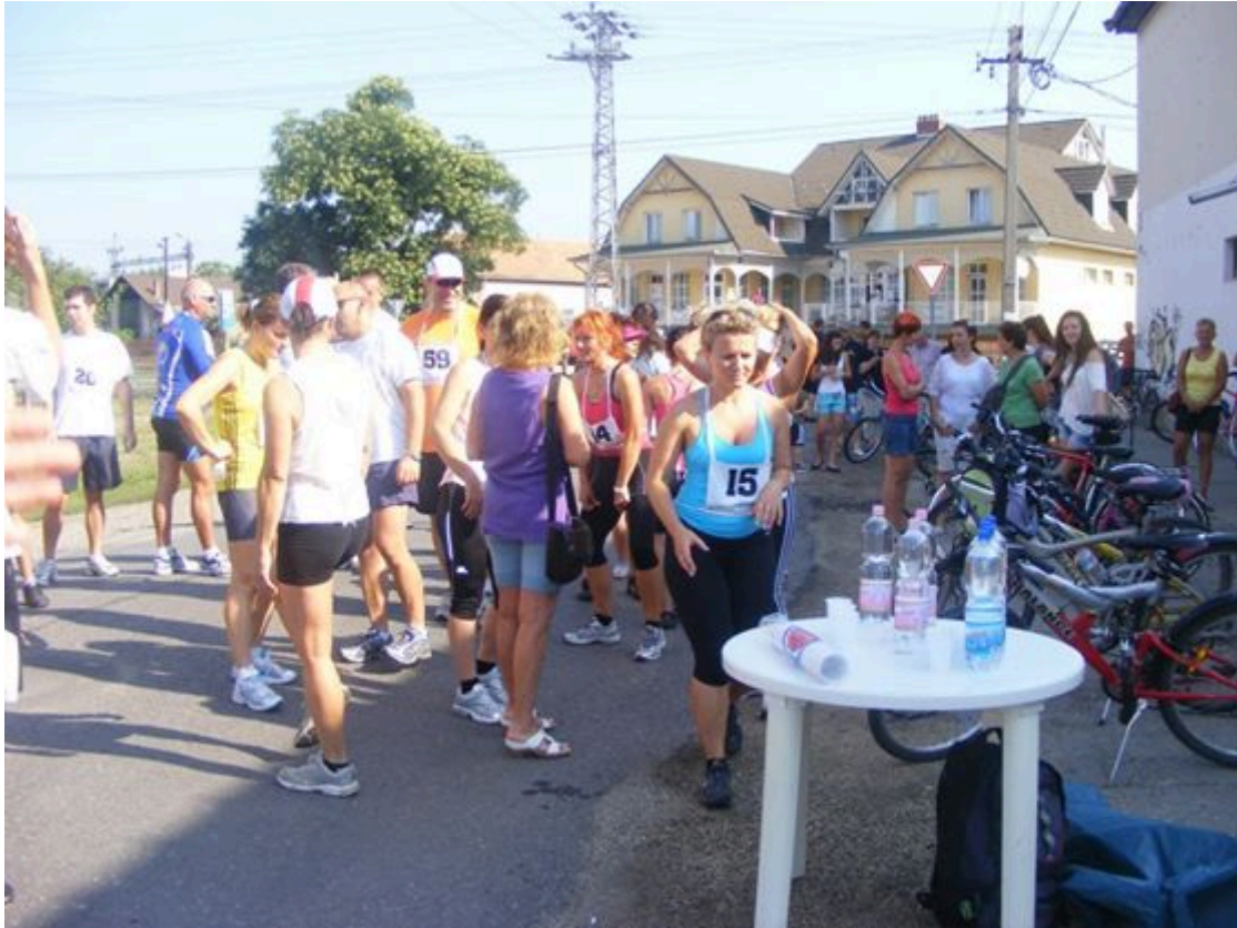
Rajt előtti pillanatok, amikor a kerékpárok még pihennek (2012. július)