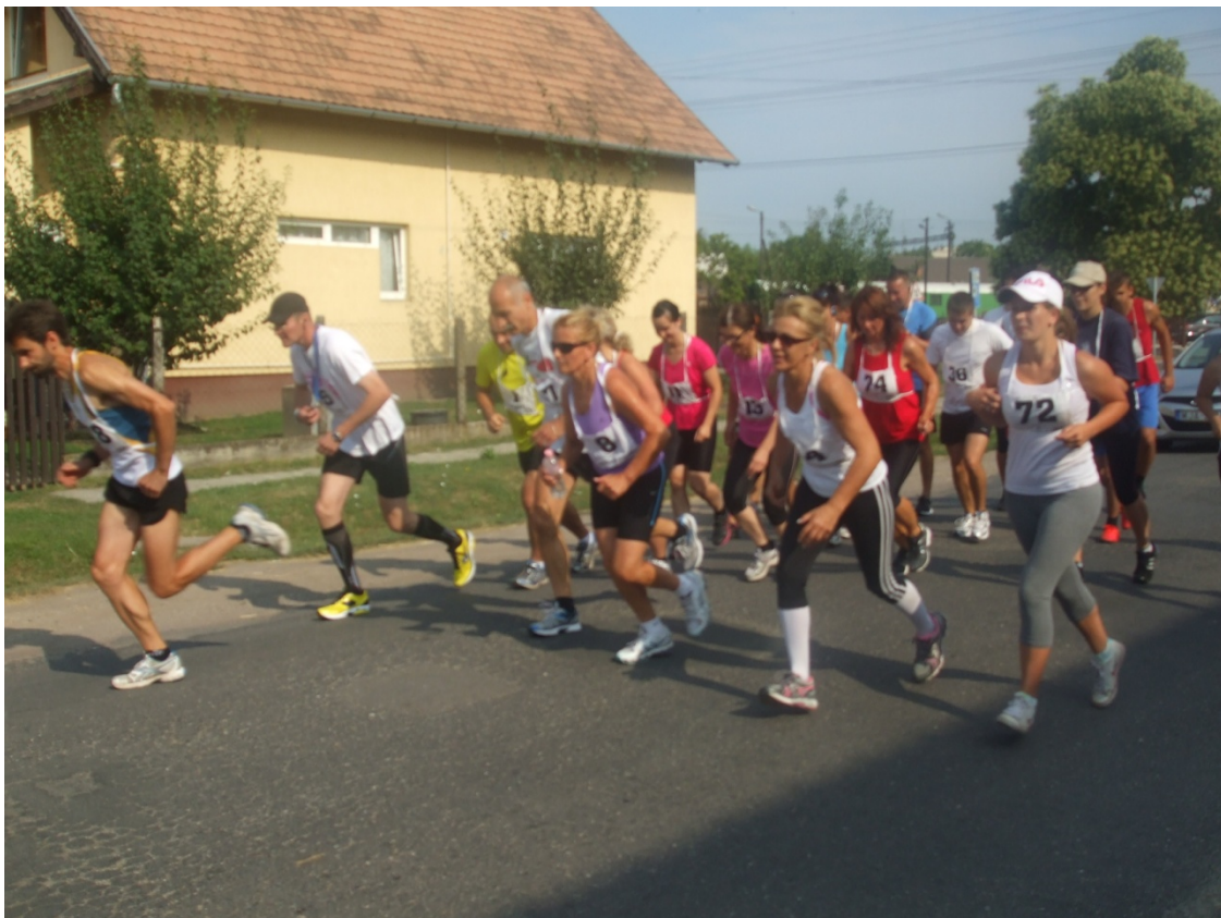
Futással rajtol a mezőny (2013. július)