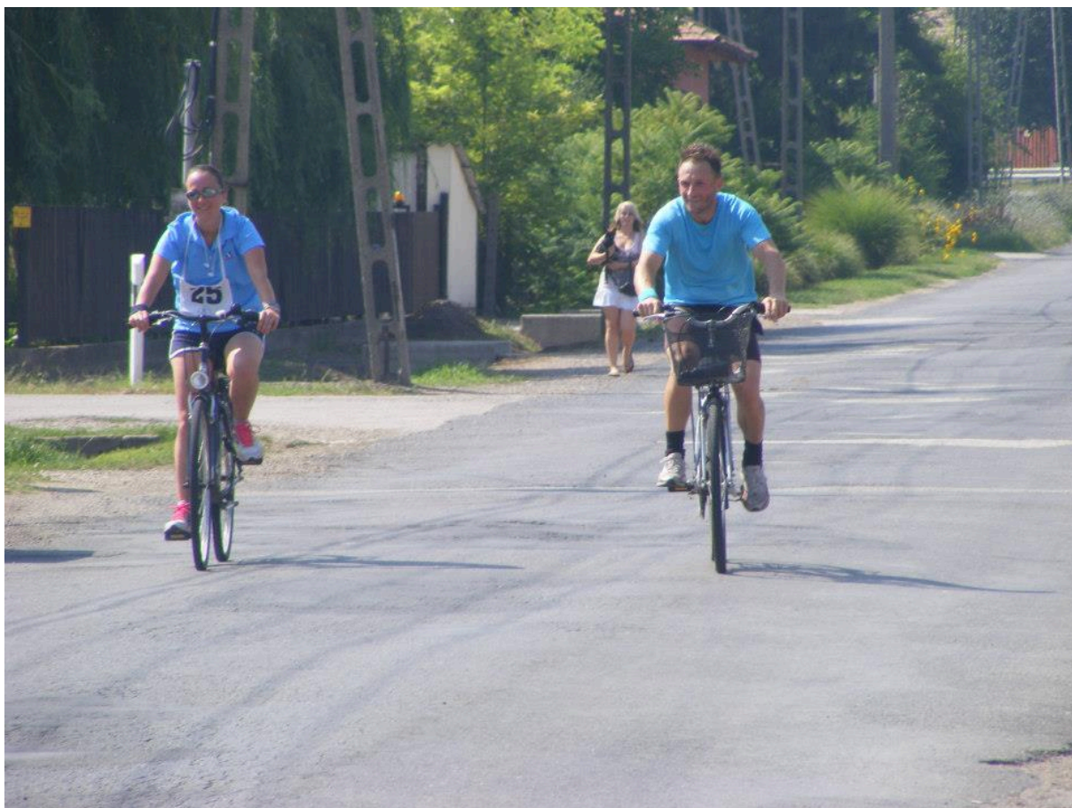
Kerékpáros befutó (2012. július)